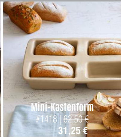
Mini-Kastenform #1418 | 62,50 € 31,25 €