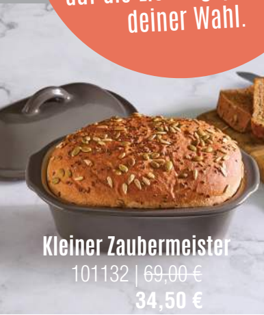
Kleiner Zaubermeister 101132 | 69,00 € 34,50 €