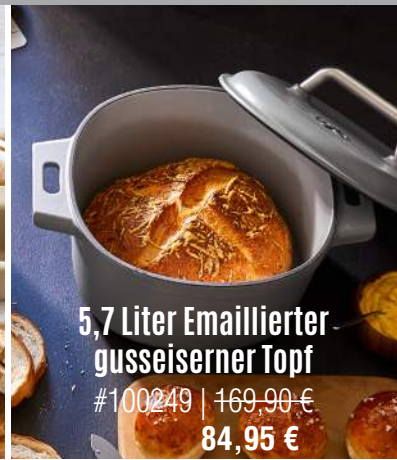
5,7 Liter Emaillierter gusseiserner Topf #100249 | 169,90 € 84,95 €