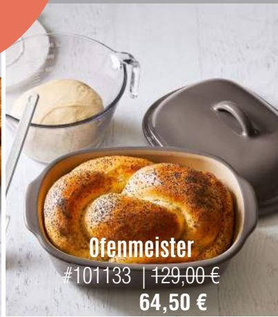
Ofenmeister #101133 | 129,00 € 64,50 €