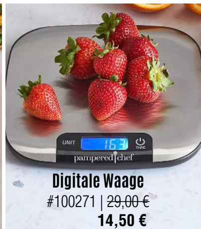
Digitale Waage #100271 | 29,00 € 14,50 €