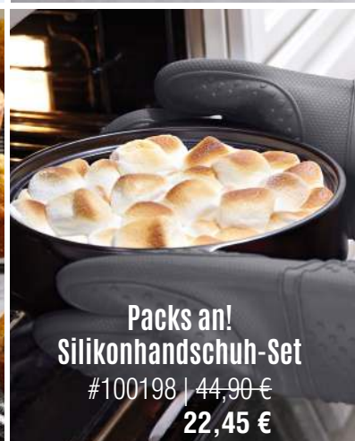
Packs an! Silikonhandschuh-Set #100198 | 44,90 € 22,45 €