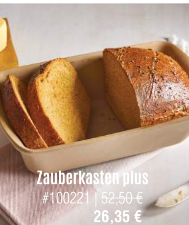
Zauberkasten plus #100221 | 52,50 € 26,35 €