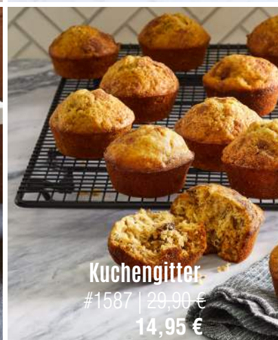
Kuchengitter #1587 | 29,90 € 14,95 €