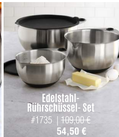
Edelstahl-Rührschüssel-Set #1735 | 109,00 € 54,50 €