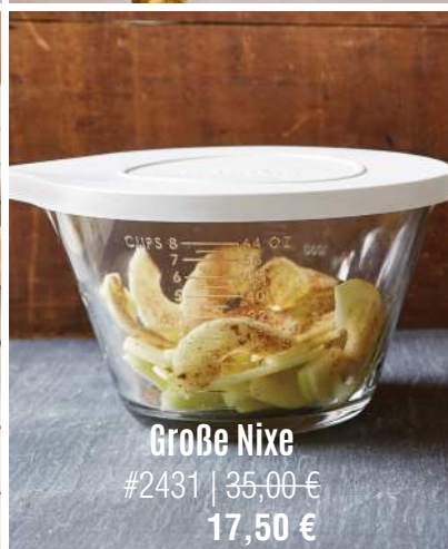
Große Nixe #2431 | 35,00 € 17,50 €