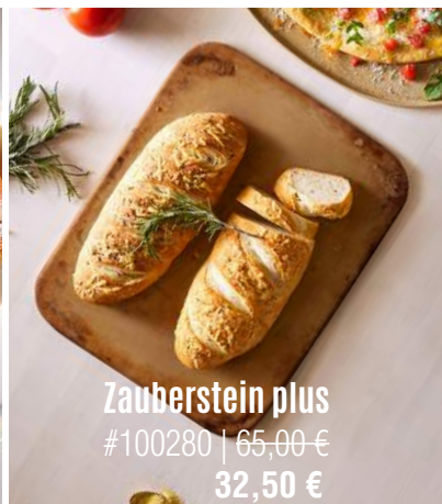
Zauberstein plus #100280 | 65,00 € 32,50 €